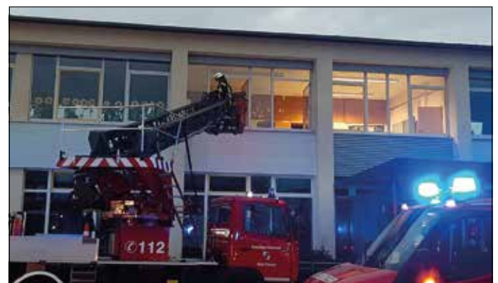
Erste-Hilfe-Maßnahmen und Betreuung