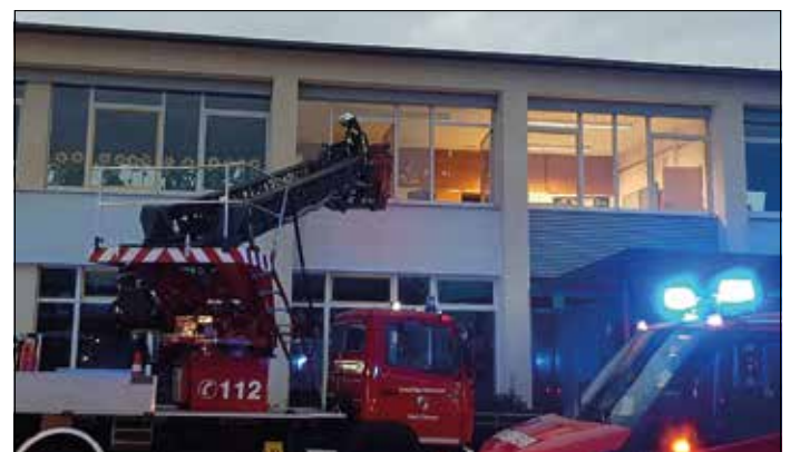
Rettung mit der Drehleiter.