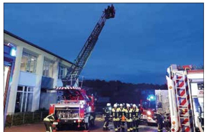
Transport der Verletzten aus dem Gefahrenbereich