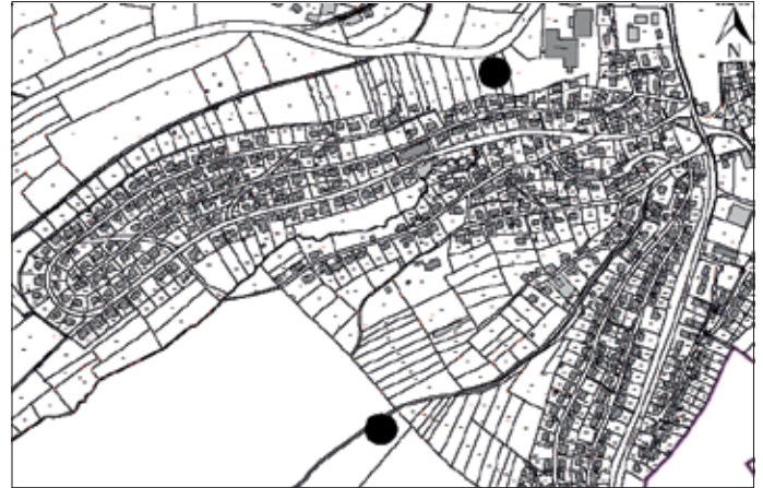
Etwaige Lage der beiden Standorte

Fl.Nr. 2165 Gemarkung Eltmann (Eigentümer Stadt Eltmann), Wald am Öhrberg. Bei diesem Standort wäre der Aufwand für die Deutsche Funkturm GmbH höher, aber bessere Einbindung in das Landschaftsbild, da Mast zum Großteil durch Waldbewuchs kaschiert wird und nur die Spitze mit den Antennen über dem Waldniveau liegen würde (vgl. Mobilfunkanlage am Ebersberg) sowie positive Bewertung durch Untere Naturschutzbehörde v. 27.01.2021.