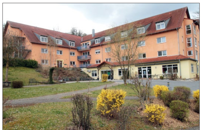
Blick auf das Seniorenhaus St. Stephan, das im Jahre 2001 eröffnet und 2016 modernisiert und umgebaut wurde.

Er richtete deswegen einen großen Dank an die Betreiber von „Curavivum“, dass sie das Haus übernommen haben. „Damit fällt uns ein großer Stein vom Herzen, zumal wir damit wissen, dass hier mit Curavivum kein Schnäppchenjäger am Werk ist, sondern ein Consortium und Personen, die es mit voller Erfahrung und Eifer betreiben wollen.“