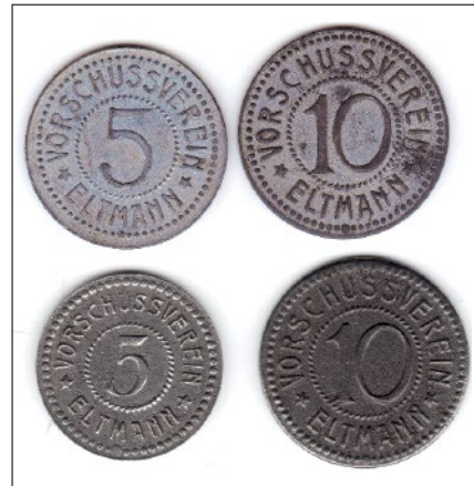
Die Vorderseiten der Notmünzen; oben erste, unten zweite Serie

Die Stücke der ersten Serie sind aus Zink, die der zweiten aus Eisen. Die Münzen tragen auf der Vorderseite, jeweils von einem Perlenkranz umgeben, die Umschrift „VORSCHUSSVEREIN * ELTMANN **“ und in der Mitte die Ziffer „5“ bzw. „10“. Auf den gleichermaßen gestalteten Rückseiten lautet die Umschrift „KLEINGELDERSATZMARKE * * *“, in der Mitte steht wiederum die jeweilige Wertziffer. Ein Datum ist nicht mit aufgeprägt, lediglich in einer Abrechnung des Vereins für das Jahr 1918 (in: StadtAE, Eltmann III O 16) wird die Ausgabe von 9.704,25 Mark für „Kleingeld-Ersatz-Marken“ aufgeführt. Demnach dürfte nach Schätzung des Numismatikers Ralf Müller (Miesbach) die Gesamtauflage der Münzen der ersten Serie ca. 10.000 (5 Pfg.) und 20.000 (10 Pfg.) bzw. bei denen der zweiten ca. 30.000 und 50.000 Stück betragen haben. Während die 10-Pfennig-Stücke beider Serien einen Durchmesser von 20 mm haben, beträgt dieser bei den 5-Pfennig-Stücken der ersten Serie 19,2 mm und bei denen der zweiten Serie nur 17,8 mm. Wie lange das Ersatzgeld in Umlauf war, ist unbekannt; wahrscheinlich wurde es im Laufe des Jahres 1920 für ungültig erklärt und eingezogen.