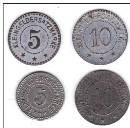
Die Rückseiten der Notmünzen; oben erste, unten zweite Serie

Die Beschreibung der Münzen erfolgte nach dem Katalog von Walter Funck: Die deutschen Notmünzen. Alle amtlichen Ausgaben und deren Varianten der Städte, Gemeinden Kreise, Länder etc. Neu bearbeitet von Ralf Müller und Wolfgang Peltzer. 8. Auflage. Regenstauf 2012, S. 160 (Nr. 116), sowie anhand persönlicher Hinweise von Herrn Müller, der freundlicherweise auch den Abdruck der Abbildungen genehmigt hat.