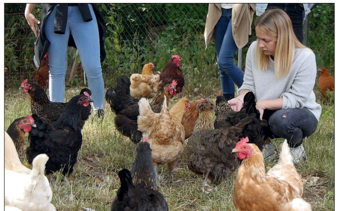
Angehende Lehrkräfte erleben einen Tag auf dem Bauernhof.

Die 12 angehenden Lehrerinnen und Lehrer zeigten sich begeistert von der interaktiven Fortbildung und wollen einen Besuch am Bauernhof gemeinsam mit ihren Klassen zukünftig einplanen.