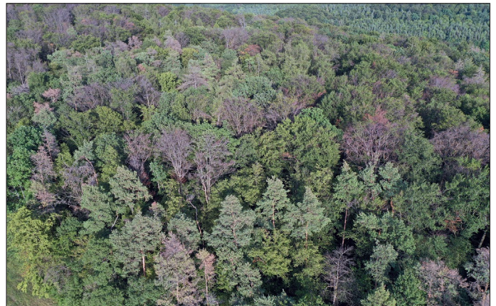
Die trockenen und heißen Sommer der letzten Jahre haben deutliche Spuren an den Buchen hinterlassen.

registrieren die Forstleute zahlreiche geschädigte oder tote Buchen. Abgestorbene Kronen, fehlendes Laub: „Buchen allen Alters macht der Klimawandel zu schaffen. Trotz ihrer tiefen Wurzeln erreicht die Buche oft kein Wasser mehr“, erklärt Ernwein. Die Folgen sind Schäden, die oft zum Absterben des Baumes führen. „Die Buchenschäden treten überall auf, wo es wärmer und trockener wird. Aktuelle Studien zeigen, dass es dabei keine Rolle spielt, ob die Wälder bewirtschaftet werden oder nicht. Entscheidend sind auch im Steigerwald der Standort mit den Rahmenbedingungen Temperatur und Niederschlag,“ so Ernwein, die aber auch davor warnt, die Buche abzuschreiben. Das Ziel, so betont sie, heißt Vielfalt. „Die Buche ist fester Bestandteil dieser Vielfalt, ohne sie wird es schwierig.“ Dass die Buche die Belastung durch den Klimawandel aber allein trägt, dürfte sie überfordern – trotz breiter Schultern und kräftigen Ellbogen.