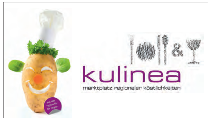
Die Logos der kulinea.

Weitere Informationen rund um die Messe sind unter www.kulinea.hassberge.de erhältlich. Nach dem Ausfall der kulinea im vergangenen Jahr ist die Vorfreude auf die Messe 2023 auf Seiten der Organisatoren nun umso größer. Die Kreisentwicklung freut sich auf viele Bewerbungen, um wieder ein prall gefülltes Schatzkästchen regionaler Köstlichkeiten bieten zu können.