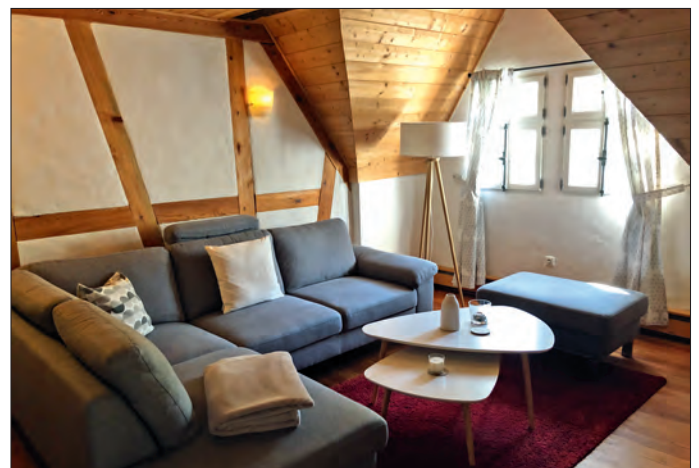
Ferienhaus Bramberger Mühle – moderne und komfortable Einrichtung in den historischen Gemäuern einer alten Mühle.

Sprechen Sie uns an: Sie erreichen uns persönlich in der Tourist-Information am Hofheimer Marktplatz, Marktplatz 1, 97461 Hofheim i.UFr., telefonisch unter 09523-5033710 oder per E-Mail an info@hassberge-tourismus.de.