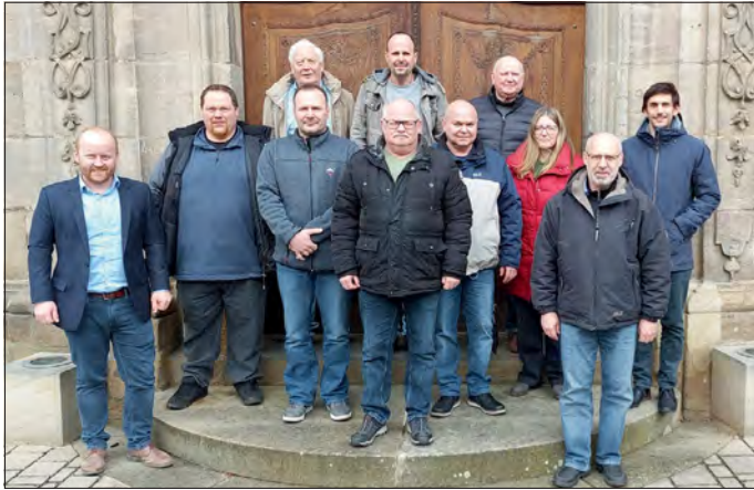
Die Teilnehmer am Seminar „Flurwerkstatt Wege- und Gewässerplanung“ Weisbrunn

Am Samstag, den 18. Februar 2023 traf sich der Vorstand der Teilnehmergeinschaft (TG) der Flurneuordnung Weisbrunn 3, Vertreter der Stadt Eltmann sowie engagierte Bürger zur sogenannten „Flurwerkstatt Wege- und Gewässerplanung“ zu einem eintägigen Seminar an der Schule für Dorf- und Flurentwicklung in Klosterlangheim (Oberfranken).