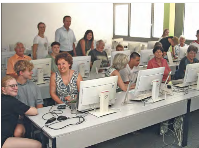
Die Kursteilnehmer an den Computern und ihren Geräten bei ihrer Betreuung durch die Schülerinnen und Schüler der 8. und 9. Klassen.

Da erklärt ein Schüler einer Frau, wie man sich auf dem Computer besser zurechtfinden kann und es sinnvoll ist, Ordner einzurichten, um Vorgänge wieder zu finden. An einer anderen Stelle wird schon über Facebook, Instagram und Youtube informiert und eine andere sitzt gerade über einer E-Mail mit Anhängen.